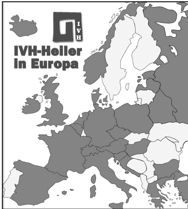
Weitgespanntes Netz: Die IVH vermittelt bisher herausragende Heiler aus den dunkel gekennzeichneten Ländern Europas ....

... darüber hinaus aber auch weltweit - von Japan bis USA, von Lettland bis zur Mongo- lei, von Israel bis Neu- seeland, von Kanada bis Kirgisien. (Stand: Frühjahr 2008.)